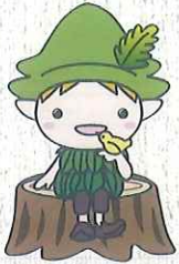
森林植物園マスコットキャラクター モリンくん

面積 約142ha 標高 約450m (森林展示館前広場) 約410m (長谷池周辺)