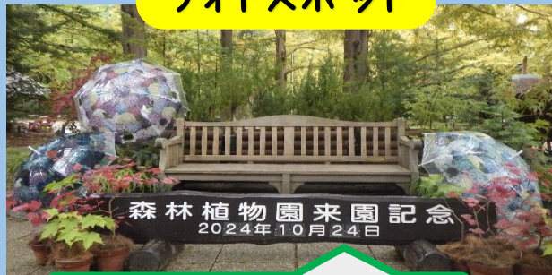
森林植物園来園記念 2024年10月24日