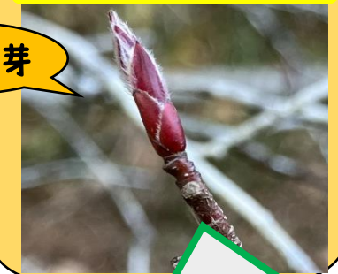
ザイフリボク(冬芽)